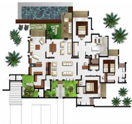
Villa de 3 Chambres - 330 mètres carrés