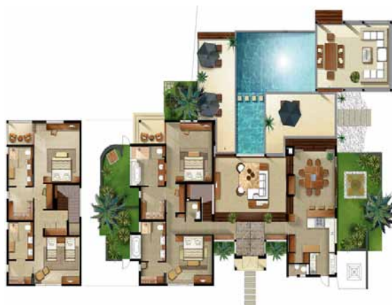
Villa de 4 Chambres - 397 mètres carrés