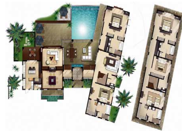
Villa de 5 Chambres - 485 mètres carrés